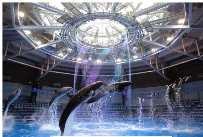
「春くるくるり」 ※イメージ

【開演時間】 11:30/13:00/14:30/16:00/17:30 (約15分間)