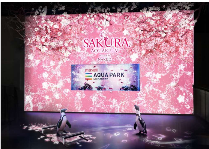
「お花見ペンギン」※イメージ

通常は2階(展示室/屋外のミニパフォーマンス)でご覧いただいている“ケープペンギン”が、エントランス「桜便り」に登場！身体能力を生かしたパフォーマンスを次々と披露し、そこへプロジェクションマッピングが連動していきます。最後には、床と壁一面に満開の桜を咲かせ、ゲストの皆さまと一緒に「お花見」を楽しみます。