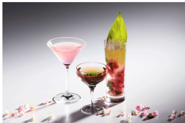
「桜をイメージしたオリジナルカクテル」 ※イメージ