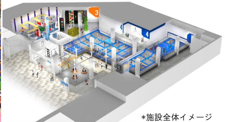
*施設全体イメージ