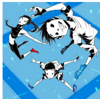
フリートランポリン