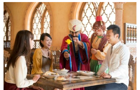
「カスバ・マジックトリート」

ジャファーをイメージした装飾が施された「カスバ・フードコート」の店内では、「マジックランプシアター」に登場するシャバーンとアシーム、その他アラビアのマジシャンたちが、様々なマジックでお食事中的のゲストをおもてなしします。