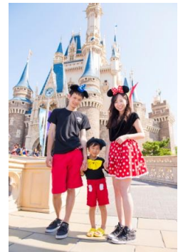
衣装しているゲスト