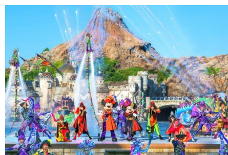
東京ディズニーシー「ザ・ヴィランズ・ワールド」