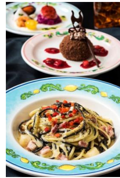
スペシャルセット 1,880 円 販売店舗 「カフェ・ポルトフィーノ」