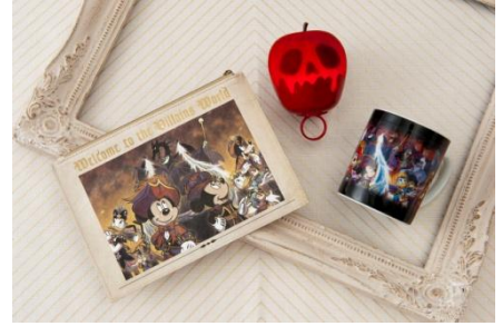
ポーチ 1,200 円 光る毒リンゴ 1,600 円 マグ 1,500 円

ディズニーヴィランズとディズニーの仲間たちがデザインされたスペシャルグッズを約55種類販売します。ディズニーヴィランズたちをモチーフにしたカチューシャや、ディズニー映画『白雪姫』に登場するウィックド・クイーンが作る毒リンゴをデザインした光る毒リンゴなど、個性的なグッズが登場します。 ※スペシャルグッズは9月3日（月）より先行販売します