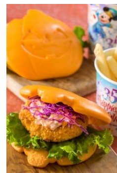
スペシャルセット 990 円 販売店舗 「ヒューイ・デューイ・ルーイの グッドタイム・カフェ」