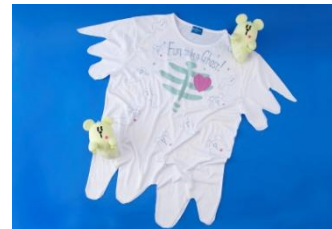
ぬいぐるみ 各 1,500 円 Tシャツ レディース 3,100 円 メンズ 3,300 円