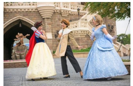
ディズニー仮装プラス

プログラムのテーマにあったディズニーキャラクターの仮装をご自身でご準備いただき、仮装したキャラクターになりきれるよう、案内役のキャストが振る舞いやポーズを紹介したり、その仮装がよく映える場所へご案内したりと仮装の楽しさが倍増するプログラムです。