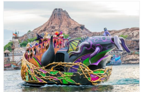
「ザ・ヴィランズ・ワールド」

メディテレーニアンハーバーでは、ディズニーアニメーションに登場する悪役たち“ディズニーヴィランズ”が、今年も妖しげで華やかなハロウィーン・パーティーを開催します。ヴィランズに招待されたディズニーの仲間たちは、ヴィランズに敬意を表し、それぞれのヴィランズをイメージしたコスチュームを身にまとうてハロウィーン・パーティーに参加します。