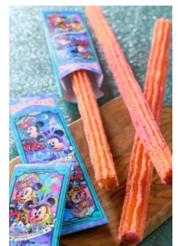
チュロス(メイプルパンプキン) 1本 350 円 販売店舗 「パークサイドワゴン」