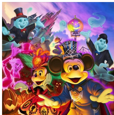
東京ディズニーランド「ディズニー・ハロウィーン」

メディテレーニアンハーバーでは、「ザ・ヴィランズ・ワールド」を公演します。今年もディズニーヴィランズが主演のハロウィーン・パーティーを開催。ミッキーマウスやディズニーの仲間たちは、ヴィランズをイメージしたコスチュームを身にまとってハロウィーン・パーティーに参加し、ゲストと一緒に盛り上がります。