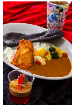
スペシャルセット 1,580 円 販売店舗 「カスバ・フードコート」