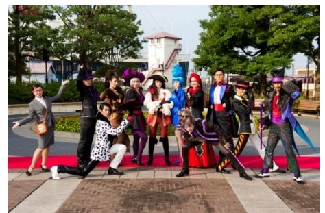
「ヴィランズ・ハロウィーン・パーティー」

今年もヴィランズの手下たちが、皆さまに会いにやってきます。妖しげな雰囲気をかもしだすウォーターフロントパークでは、ヴィランズの力で魅力的な人間の姿に変えられた手下たちが今年もリクルーティング活動を行います。多くの手下たちが日々訪れ、ヴィランズの素晴らしさをアピールし、仲間となってくれるゲストを探します。