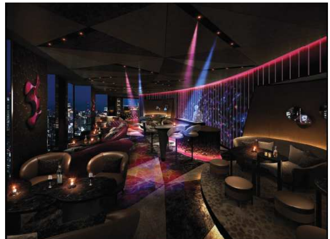
DJ サウンドバー(イメージ)

◎本件に関する報道各位からのお問合せは 株式会社プリンスホテル 高輪・品川マーケティング戦略 TEL: 03-3447-1133(直通) FAX: 03-3473-1115