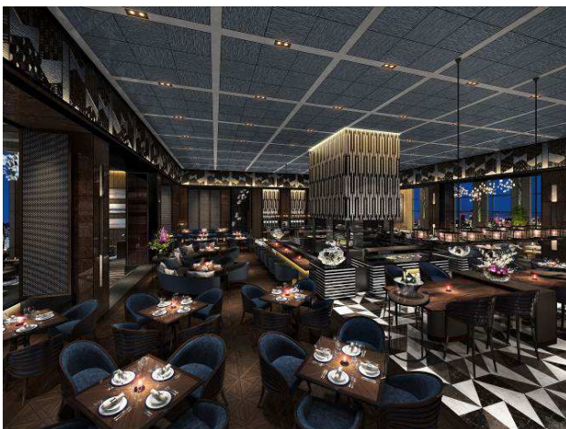
エキサイティング アーバンダイニング(イメージ)

このように、ホテル最上階 39F に“東京と遊び”をマッチングさせた新たなレストラン「Dining&Bar TABLE 9 TOKYO」をオープンすることで、品川の街の一大エリアを担うエンターテインメントホテルとして、街への更なる集客を図ってまいります。