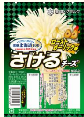
ボンバー さけチー