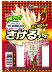
ファイアー さけチー

レアパッケージの割合は、2本入りは16分の1、1本入りは32分の1。なので、見かけた方はかなり強運です！