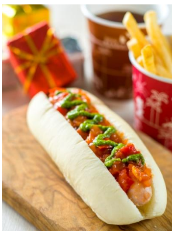
「リフレッシュメントコーナー」 スペシャルセット 900円 （東京ディズニーランド）