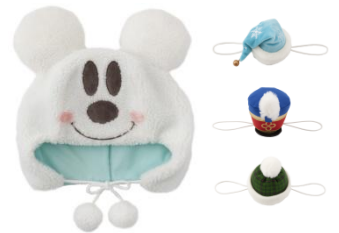
ファンキャップ 2,000円 パーツ 各600円 (両パーク共通)