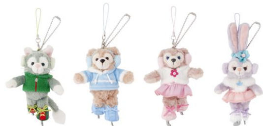
ストラップ 各1,700円 (東京ディズニーシー)