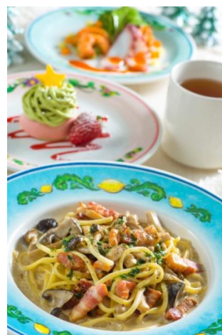
「カフェ・ポルトフィーノ」 スペシャルセット 2,180円 （東京ディズニーシー）