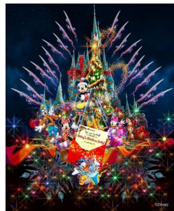
東京ディズニーランド 「ディズニー・ギフト・オブ・クリスマス」

夜、メディテレーニアンハーバーの水上で公演する「 カラー・オブ・クリスマス 」では、今年新たに雪が舞い降りる演出が加わり、よりロマンティックな雰囲気をお楽しみいただけるほか、ディズニーの仲間たちも新しいコスチュームで登場し、ゲストと一緒に願いをかけ、水上のクリスマスツリーを幻想的に輝かせます。