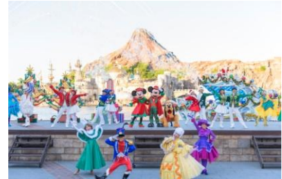
東京ディズニーシー 「パーフェクト・クリスマス」

ショーの最後には、たくさんの雪が舞う中、色鮮やかなパイロが打ち上がり、華やかなフィナーレを迎えます。