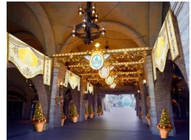
ミラコスタ通りのデコレーション