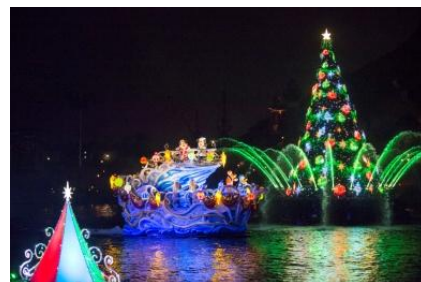
東京ディズニーシー 「カラー・オブ・クリスマス」