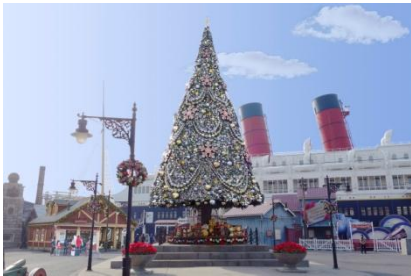
アメリカンウォーターフロントのクリスマスツリー

また、ロストリバーデルタでは、中南米をイメージした赤や緑の原色の飾りが幻想的なイルミネーション「フィエスタ・デ・ラ・ルース」（スペイン語で「光の祭り」の意）を今年も実施します。