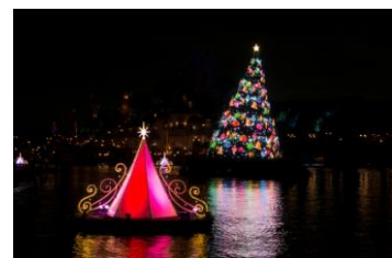
東京ディズニーシー 「カラー・オブ・クリスマス-アフターグロウ」

「カラー・オブ・クリスマス」で人々の願いが集まり光り輝いたクリスマスツリーとツリーのオブジェは、花火が終わった後も光と音楽が連動して色鮮やかに変化し、輝き続けます。また今年、一部の公演では雪も舞い、よりロマンティックな雰囲気をお楽しみいただけます。