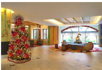
東京ディズニーセレブレーションホテル： ディスカバリーのクリスマスデコレーション