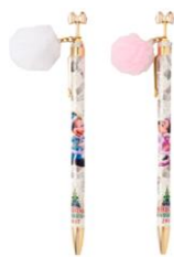
ボールペンセット 1,500円 (東京ディズニーシー)