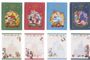
メモセット 900円 (東京ディズニーランド)