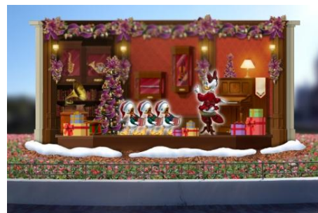
シンデレラ城前のプラザのフォトロケーション