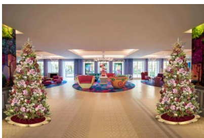
東京ディズニーセレブレーションホテル： ウィッシュのクリスマスデコレーション