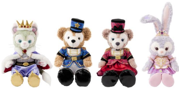
コスチュームセット 各4,800円 ※ぬいぐるみ(S)は別売りです (東京ディズニーシー)