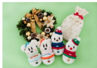
スノースノー“メイク・イット・マイン” ベーシックセット 2,200円 パーツ 各400円 (両パーク共通)