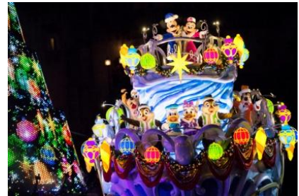
東京ディズニーシー 「カラー・オブ・クリスマス」

今年は新たに雪が舞う演出が加わり、夜のメディテレーニアンハーバーをよりロマンティックに彩るほか、ミッキーマウスをはじめとするディズニーの仲間たちもオーナメントをあしらった新しいデザインのコスチュームで登場します。またジェラトニーやステラ・ルー、ジーニーやアブーも初めて登場し、クリスマスの夜に輝きを加えます。