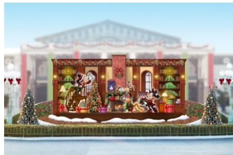
エントランスのフォトロケーション

そのほかにも、ワールドバザールのクリスマスツリーをはじめ、各テーマランドには、クリスマスならではの装飾や体験型フォトロケーションなどが登場し、東京ディズニーランドのファンタジックで楽しいクリスマスを彩ります。