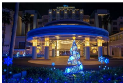
ディズニーアンバサダーホテルの クリスマスイルミネーション

そして、昨年オープンした2棟からなる東京ディズニーセレブレーションホテル®では、今年初めてそれぞれの館内にクリスマスのデコレーションを施し、クリスマスムードを盛り上げます。ディズニーホテルで、心温まる素敵なクリスマスをお過ごしください。